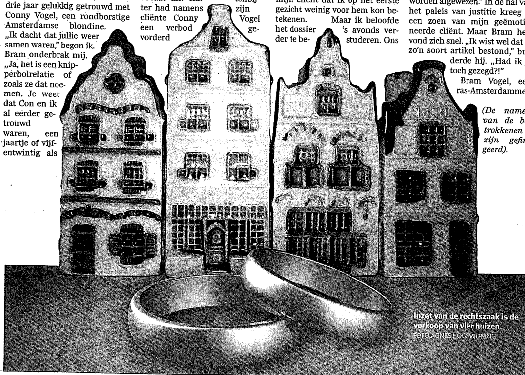
Inzet van de rechtszaak is de verkoop van vier huizen.

(De namen van de betrokkenen zijn gefingeerd.)