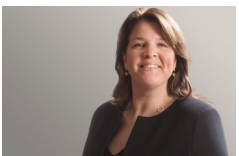
サラ・ウォーカー ロンドン