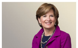
トレイシー・レンフロ ヒューストン