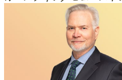
スティーブ・オニール サンフランシスコ/ロンドン