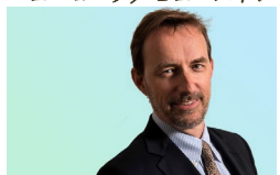
マークオリバー・ラングロア パリ