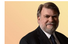
ジェイムス・カステロ パリ